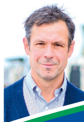
Chefs d'entreprise, chargés de la mission RSE