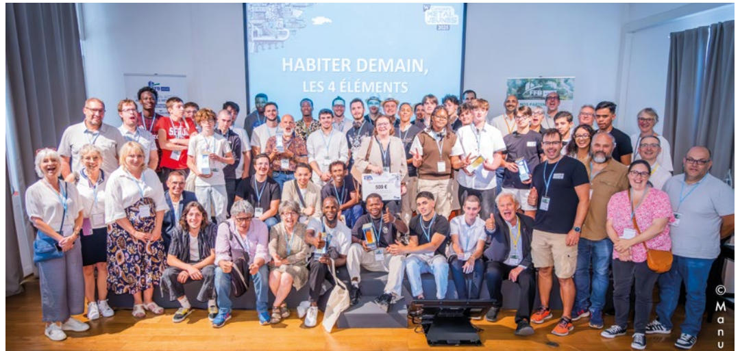
► Remise des prix de la 14 e édition du concours.

Ce moment d'échange a permis de présenter les objectifs du concours, de revenir sur l'esprit du dispositif, d'expliquer les attentes pédagogiques et techniques liées à la participation. Ce webinaire était également l'occasion de dévoiler les grandes lignes de l'édition 2027. Une 15 e édition qui aura pour thème « Le sport dans tous ses états », une thématique inspirante, riche en possibilités structurelles et créatives pour les élèves. Rappelons qu'au-delà d'une compétition, Métal'Jeunes est un temps fort pour la promotion des métiers de la métallerie. Il renforce les liens entre établissements, enseignants et entreprises, tout en mettant à l'honneur le travail, la créativité et l'innovation des jeunes. L'édition 2027, sous le signe du sport, promet d'ouvrir la voie