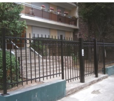
Clôture d'un site résidentiel.