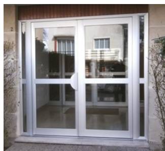
Porte de hall d'entrée en titane.

“ C'est un métier fou. Il faut être bricoleur et avoir de la jugeote, réagir au moindre problème. Chaque situation est différente... ”